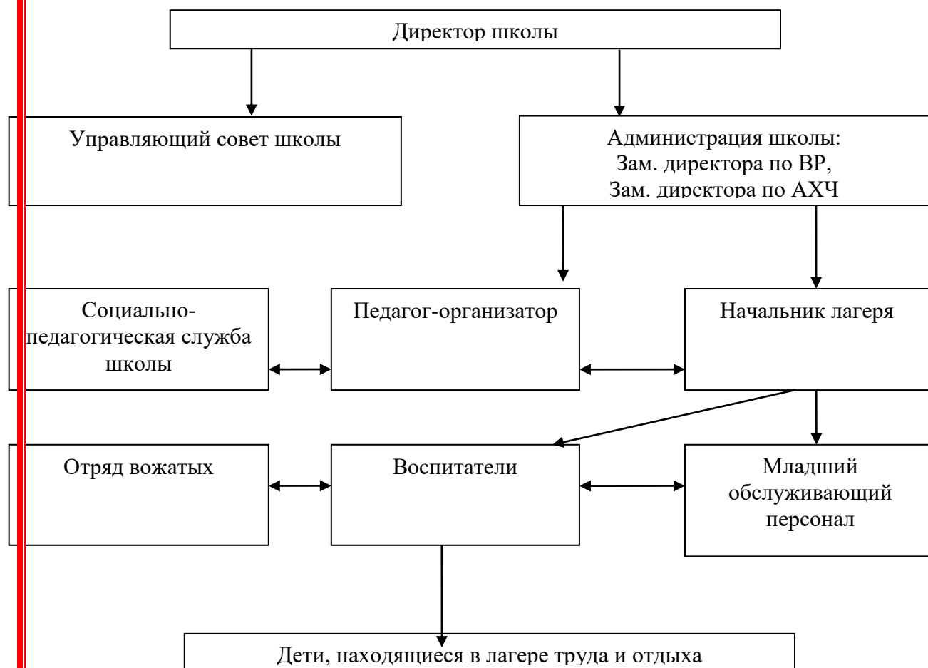
Схема управления и контроля за реализацией программы