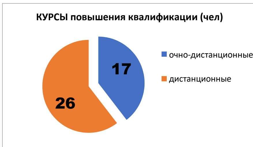
Рис.1. Количество педагогических работников МБОУ СОШ № 24, прошедших КПК в 2018-2019 учебном году

Несмотря на 95 % охваченность педагогических работников своевременным повышением квалификации, существует 100% необходимость в повышении квалификации педагогов по работе с детьми ОВЗ. Также, необходимо учитывать, что есть педагоги, совмещающие должности и прохождение курсов повышения квалификации необходимо и по смежному предмету (ОБЖ и технология, учитель музыки и педагог-организатор, учитель начальных классов и кубановедения, ОРКСЭ).