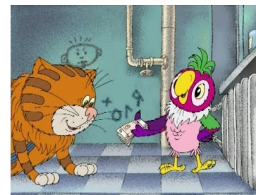
Проявления вербальной и (или) физической агрессии