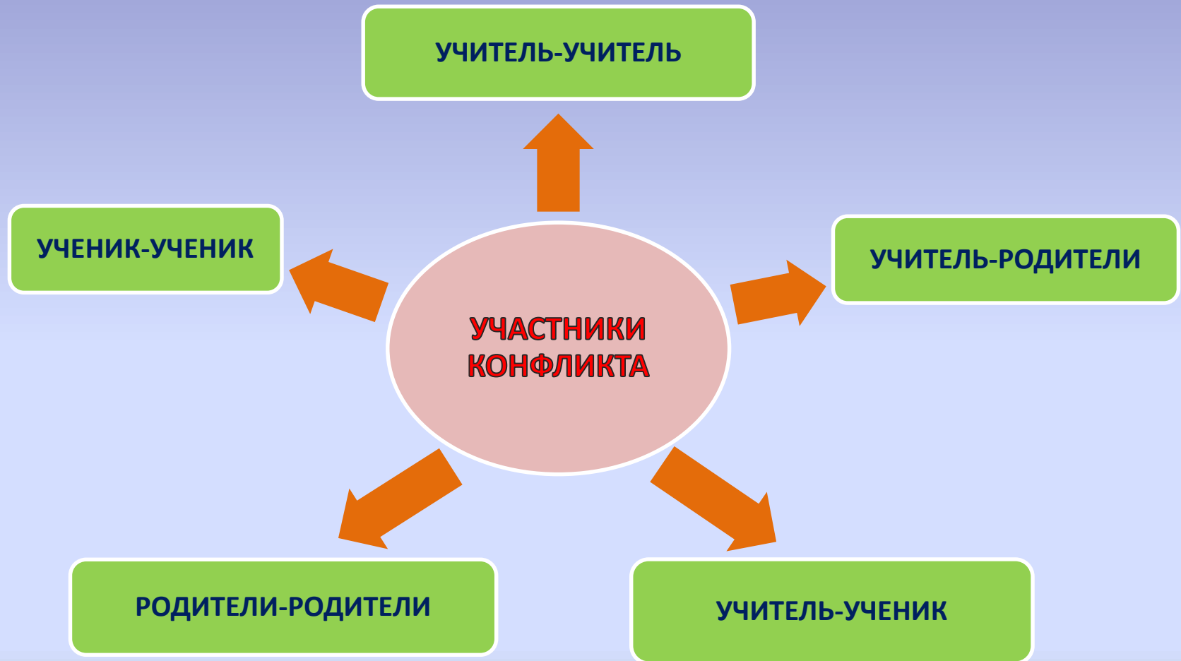
СХЕМА КОНФЛИКТНЫХ СИТУАЦИЙ В УЧЕБНЫХ ЗАВЕДЕНИЯХ